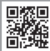
AquaBead Flex Pro